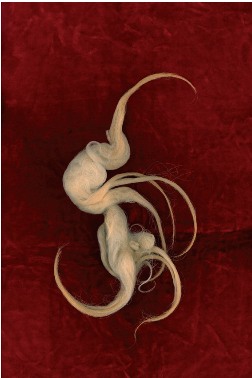
Llana01. De la sèrie Llanes.