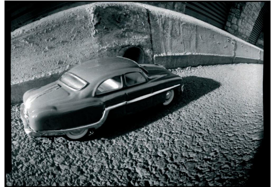
■ S/T. De la serie L'home: Oh! Gènesis, oh! mort.

mera sèrie fotogràfica de soma-trans-lúcid va guanyar ex-aequo a l'àmbit de fotografia.