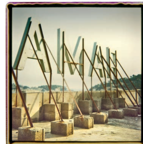
Amar. De la sèrie Polaroids Travel .

La fotografia de ciutats amb estenopecica era una altra cosa que m'interessava molt. Per això després de fer alguna sèrie a Barcelona, l'estiu del 87 vaig fer la feina de Palma, 100