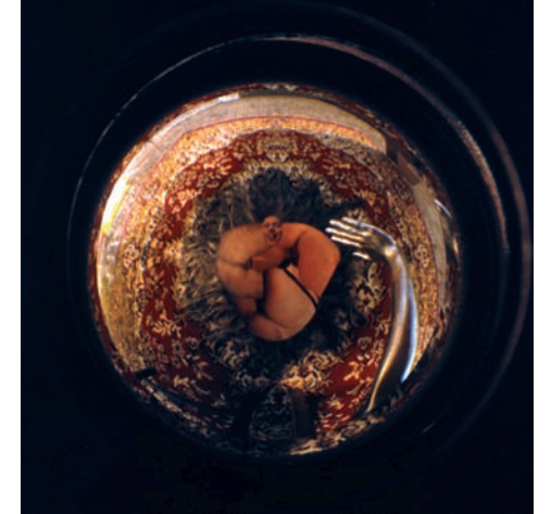
■ ST . De la sèrie Peep Show .

ello y publicar, de aquí la hegemonía de los contenidos vertidos por los programadores. Poco a poco (digo poco a poco sin perder de vista que estoy hablando de internet, esto quiere decir a una escala que podía ser de meses o incluso de semanas) empezaban a aparecer páginas que no se limitaban a enseñar lo mencionado sino que además lo interpretaban en clave artística, empezando a explotar el potencial que tenía el medio. De alguna manera era inevitable: empecé a hacer mi propia página personal.